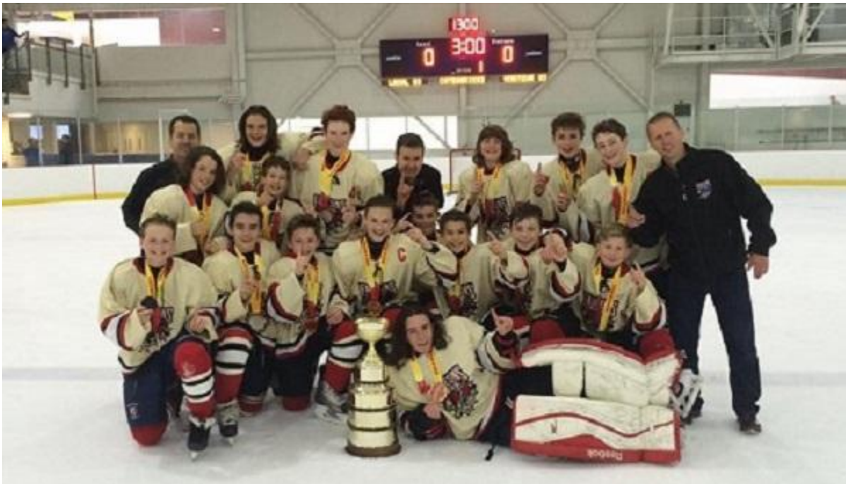
CHAMPIONS 2003 D2 FAUCONS RIVE-SUD