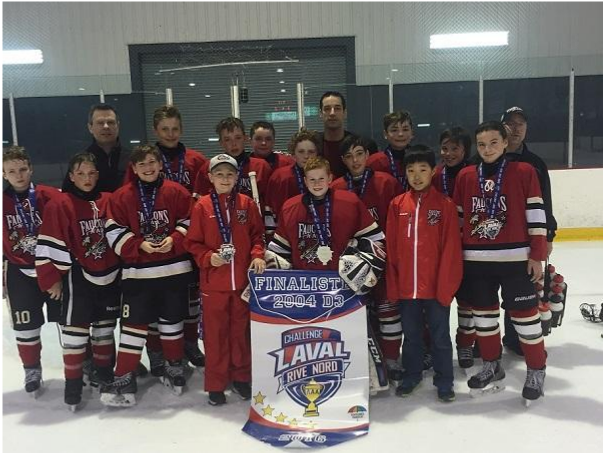
FINALISTES 2004 D3 FAUCONS ÉLITES AAA