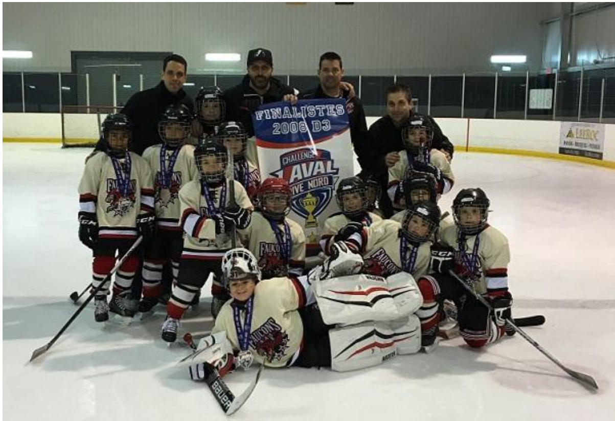
FINALISTES 2008 D3 FAUCONS ÉLITES AAA